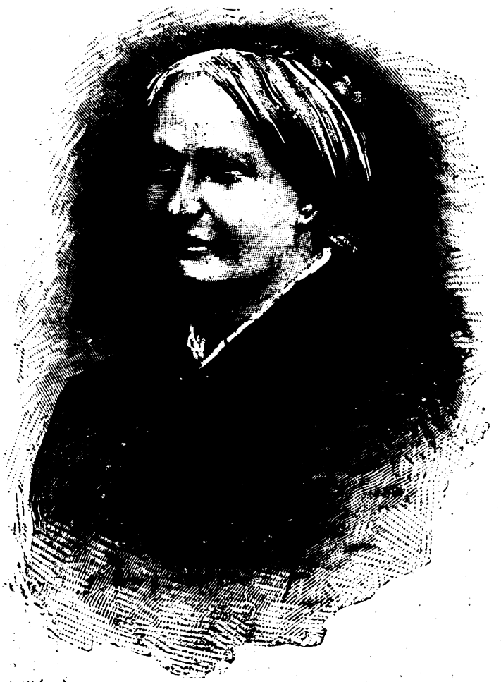
THERÈSE-CHRISTINE-MARIE, IMPÉRATRICE DU BRÉSIL