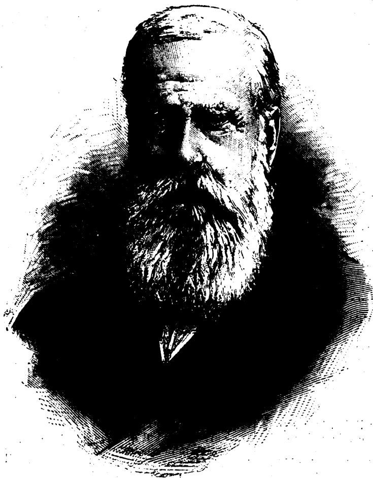
DON PÉDRO II, EMPEREUR DU BRÉSIL