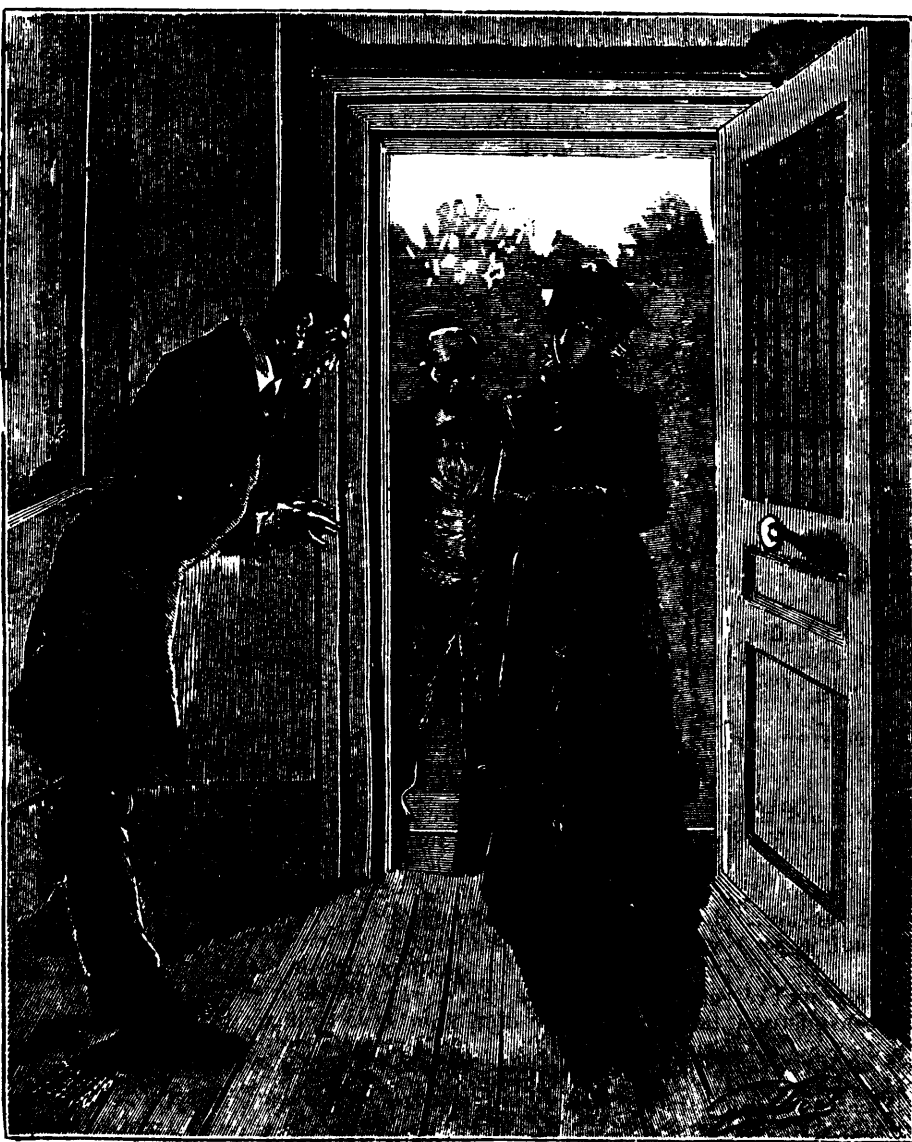
Claudia franchit le seuil de la petite maison et le policier s'inclina profondément. — (Page 185, col 3).

Le vieux bandit tremblait de tous ses membres. Ses dents claquaient. Ses prunelles roulaient dans leurs orbites agrandies.