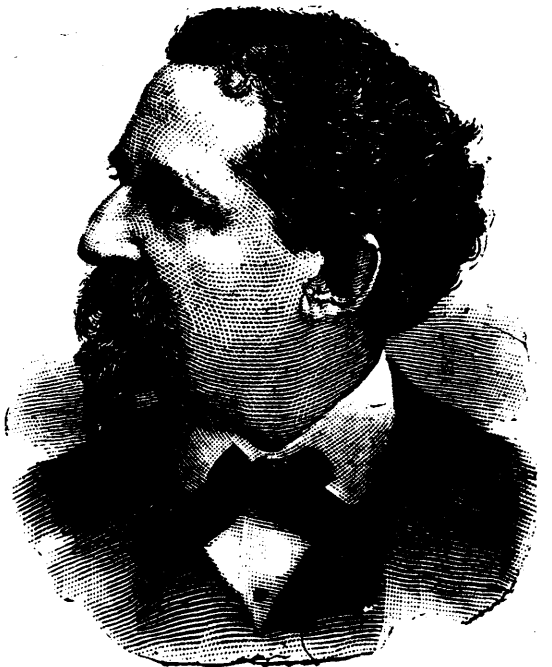
LE CAPT. MACKENZIE, VAINQUEUR DU TOURNOI