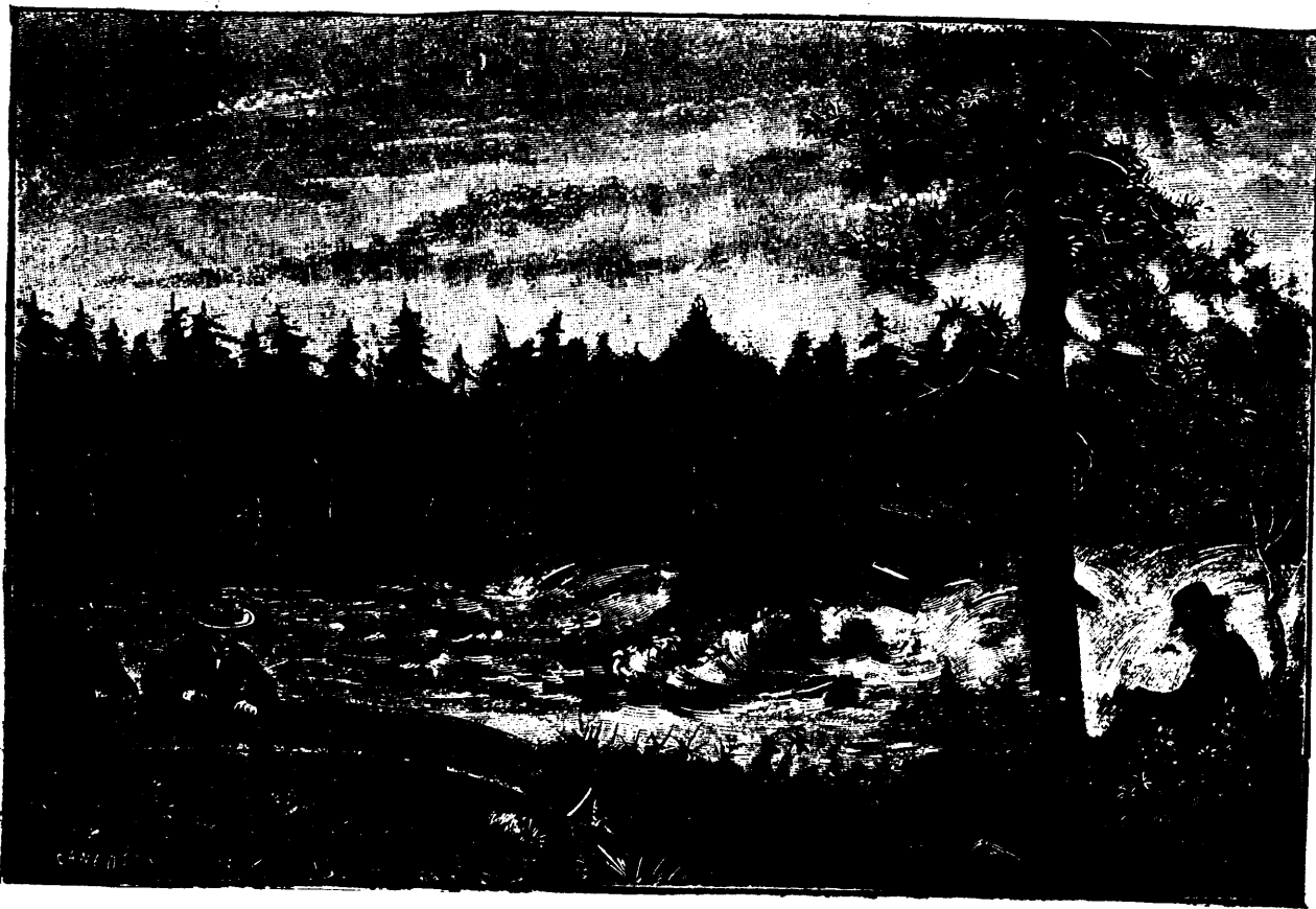
HAUT-CANADA. — Le pied des Quinze, sur la rivière Ottawa ; d'après un croquis de M. l'abbé Proulx

Ils revinrent à la nuit tombante. Les sieurs de Sainte-Hélène et d'Iberville allèrent à la découverte de si près, qu'ils sondèrent les canons et constatèrent qu'ils n'étaient pas chargés. On décida d'attaquer de tous côtés à la fois. Le sieur de Catalogne avec les soldats français, la hache à la main, devait ouvrir une brèche dans la palissade ; le chevalier de Troyes et le sieur de Maricourt, conduisant un parti de Canadiens, battraient du bélier la porte principale ; les sieurs de Sainte-Hélène et d'Iberville monteraient à l'escalade. En deux coups, le bélier défonça la porte et le chevalier de Troyes se jeta dans la place, fit faire feu dans toutes les embrasures et les meurtrières du blockhaus. Les Anglais, la plupart encore à demi vêtus, tant on avait promptement conduit l'affaire, implorèrent quartier et on leur accorda. Le fort fut remis aux Français ! L'action avait duré environ deux heures.