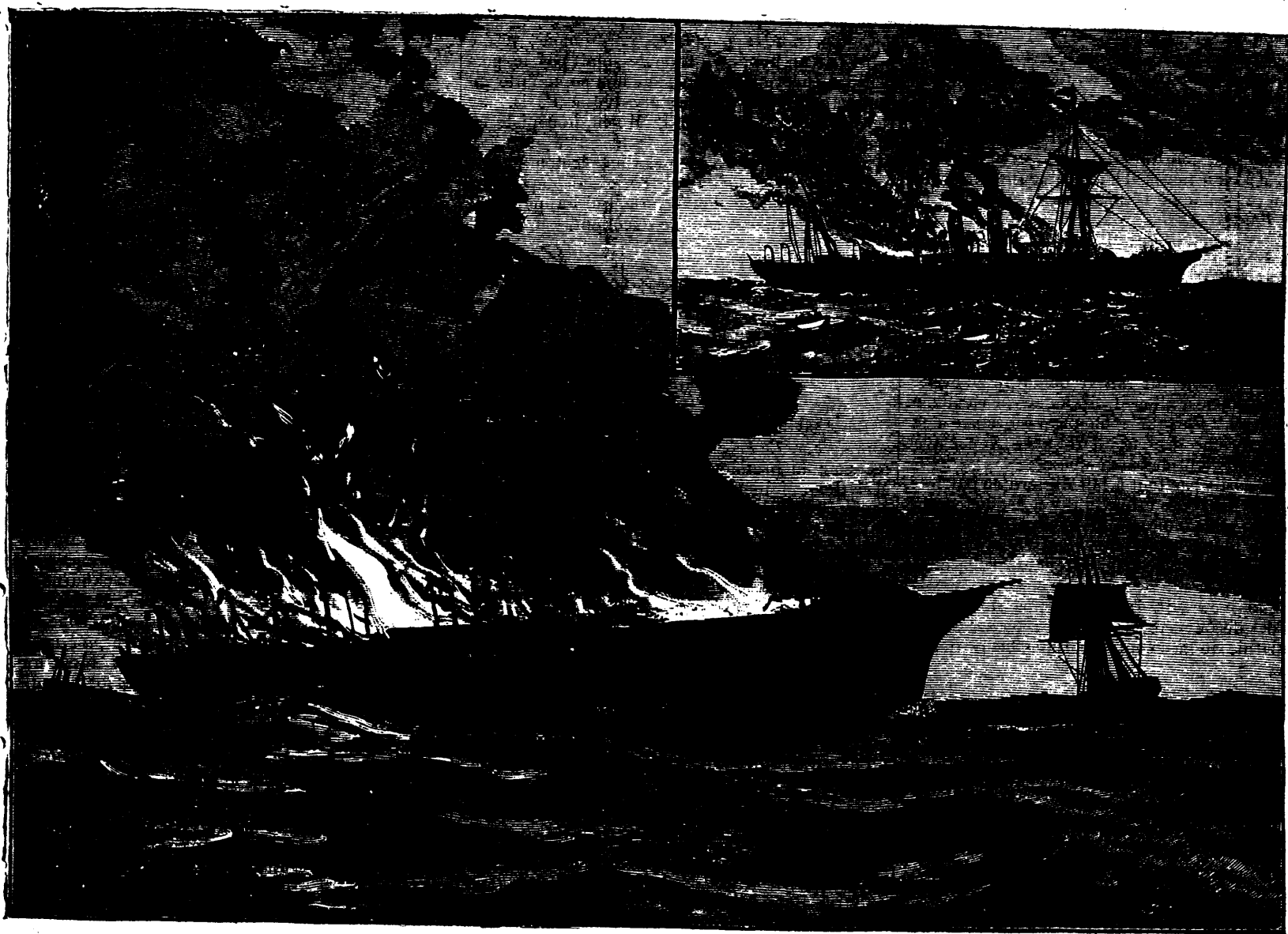
1. LE VAPEUR À 11 HEURES A. M., LE 11 AOÛT. 2. L'ÉPAVE INCENDIE DU VAPEUR CITY OF MONTREAL SUR L'OcéAN ATLANTIQUE

UN CONTRASTE INSTRUCTIF. — L'INDIEN CIVILISÉ ET L'INDIEN À L'ÉTAT SAUVAGE