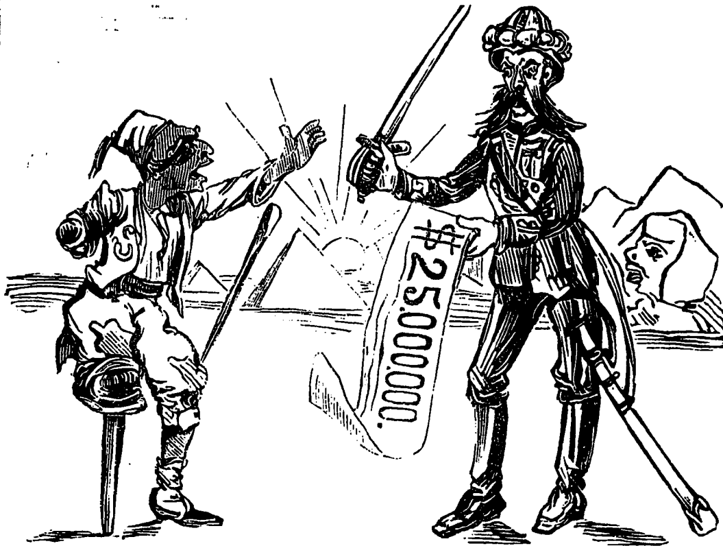
APRES LE COMBAT

L'Anglais vainqueur à l'Egyptien invalide. Aoh! Maintenant que mon avoir fini de travailler pour est vous régler cette petite compte.