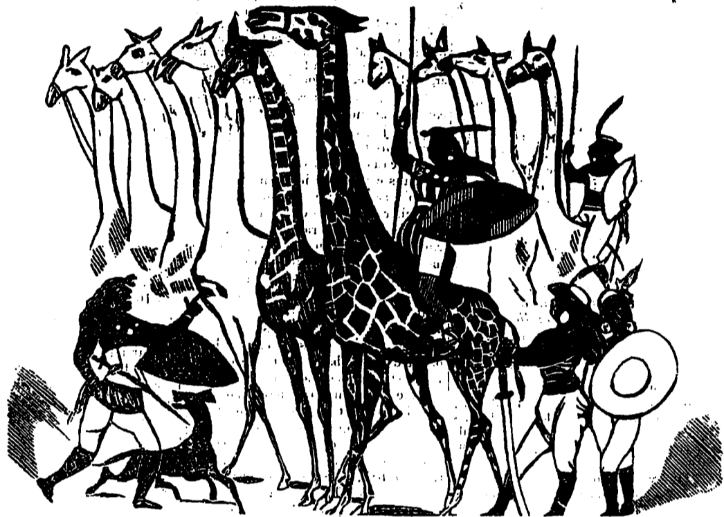
GRANDE REVUE DES GIRAFIERES. ( Voir Feuilleton. )