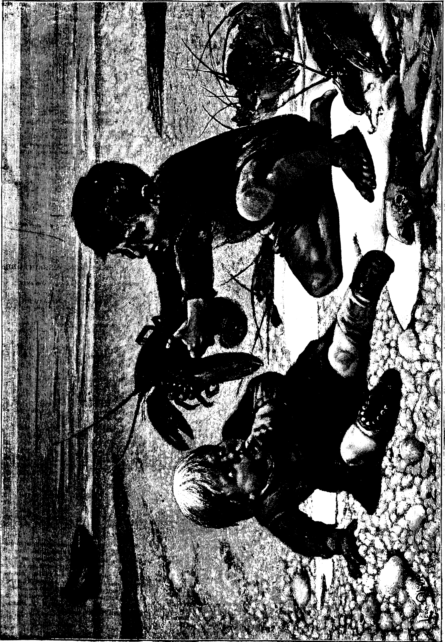
BEAUX-ARTS : FRAYEUR — TABLEAU DE M. LÉON OLIVÉ