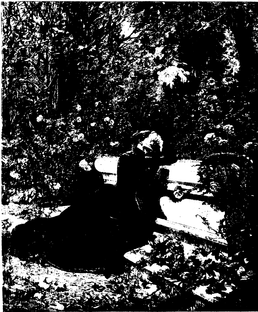
Je la suivis des yeux : elle alla s'agenouiller non loin de là près d'une tombe.—Page 190, col. 1.

—Le lendemain, cependant, je voulus les voir tous deux, et tandis que les cierges brillaient sur l'autel orné de fleurs, tandis que le calice étincelait sous son voile au milieu des nuages parfumés de l'encens, caché derrière un pilier, je fus témoin de la scène auguste ; au milieu du silence pieux des assistants, j'entendis les « oui » solennels prononcés par les époux nouveaux... Après la messe, je les vis encore s'avancer et traverser l'église, unis pour toujours ! Ils passèrent tout près de moi ; elle, souriante, s'appuyant avec confiance et abandon sur son bras loyal ; lui, sérieux et grave, mais rayonnant de tout le bonheur