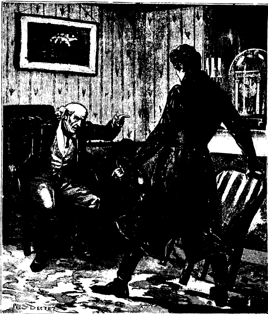
—Pas un sou ! Pas un sou ! dit-il, en le menaçant du doigt. —Page 6, col. 2.

—Non, mais c'est utile. Tu as trois billets de trois mille francs chacun, souscrits à l'ancien horticulteur Virlovet et dont tu as acheté l'établissement pour tes fils. De trois mois en trois mois, depuis un an, tu renouvelles ces billets, Virlovet s'est impatienté à la fin. Au dernier