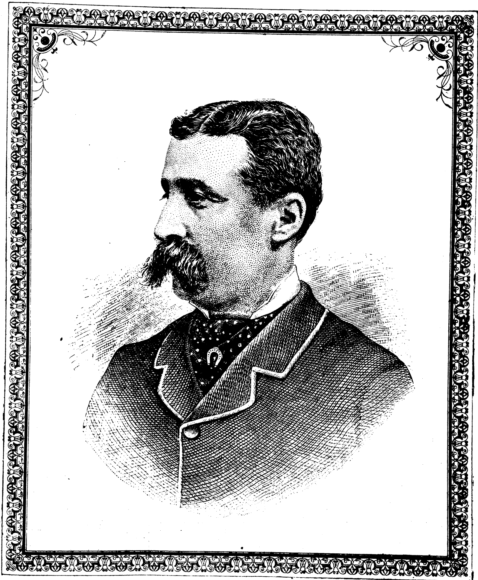
SIR A. P. CARON Ministre de la Milice du Gouvernement du Canada

La ligne, par insertion . . . . . 10 cents Insertions subséquentes . . . . . 5 cents Tarif spécial pour annonces à long terme