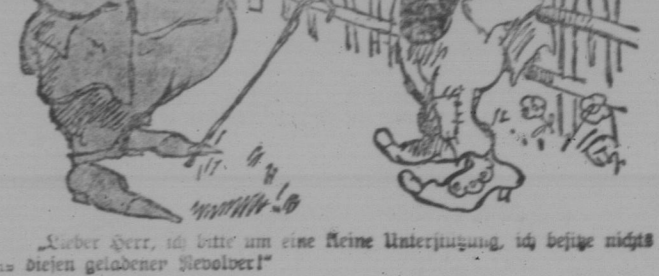
„Aber Herr, ich bitte um eine kleine Unterjagung, ich besitze nichts so vielen geladener Revolver!“