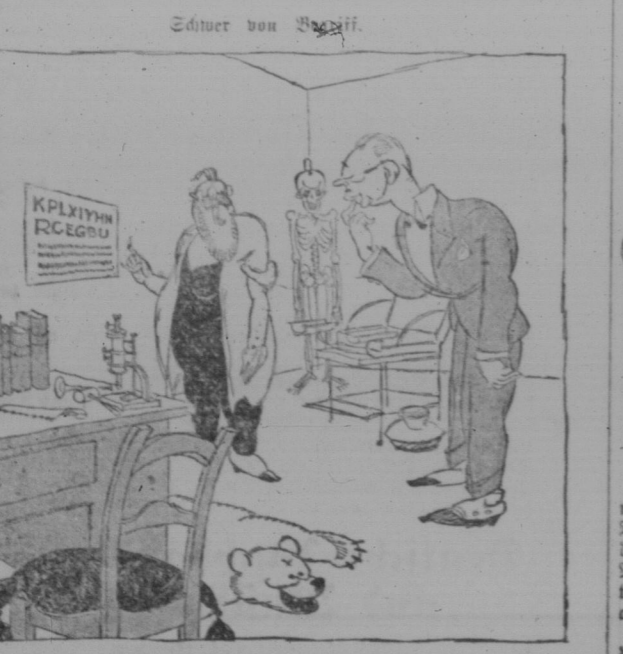
„Kannst du das lesen? Lesen kann, aber nicht verstehen.“