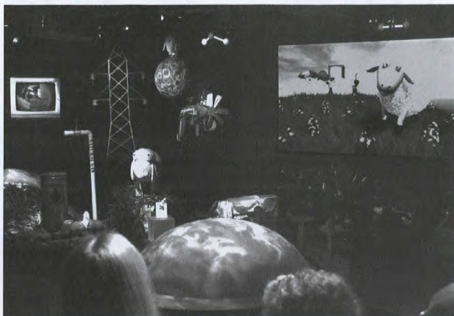
The Climate Change Show, exposition du théâtre d'objets de Science North Entreprises de Sudbury

La mission a coïncidé avec la National Manufacturing Week Trade Show, la plus