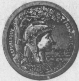
MÉDAILLE D'ARGENT Exposition Universelle de Paris 1900.

Nous accordons des prix spéciaux aux membres du clergé, et aux communautés religieuses. Réparation de livres à des prix modérés. Estimés fournis sur demande.