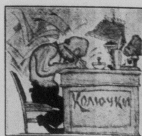
Чудак, покійник, ей богу!

Бувший посол Кракалія, якого недавно арештовано, сидить в румунській військової в'язниці. В останньому часі Кракалія мав заявити, що коли його не випустять з тюрми, то він розпочне голодовий страйк.