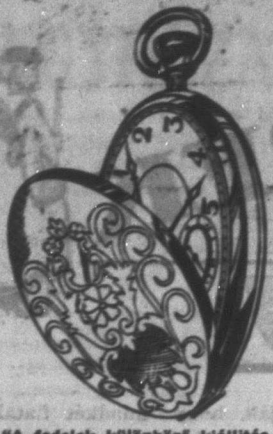
*A fedelek különböző mélyítésű kaphatók.

Hungarian Import Company 545 MAIN ST., WINNIPEG, MAN.