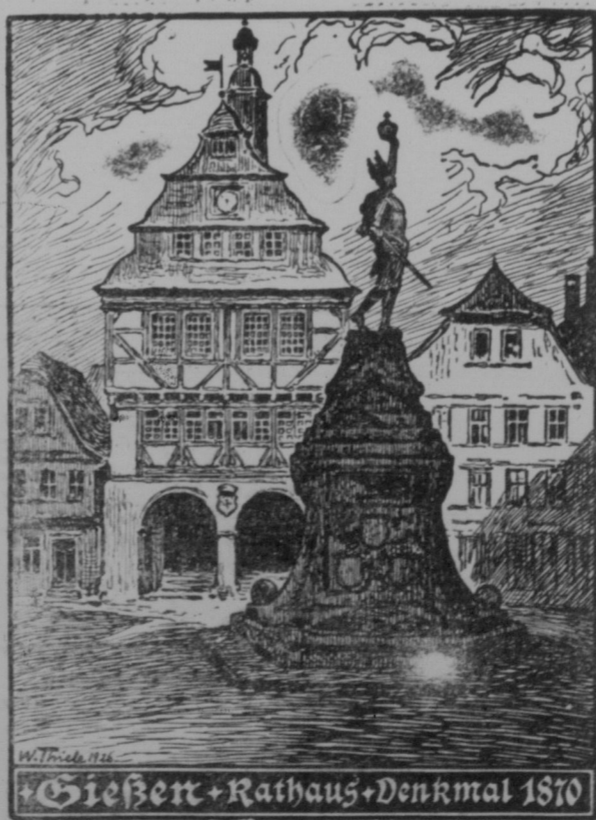
Gießen + Rathaus + Denkmal 1870

Am linken Ufer der Elbe, umgeben von sanften Hügel und Wäldern, erhebt sich die alte deutsche Stadt, die Urhütte ihres Namens ist dunkel und verliert sich in die graue Dämmerung.