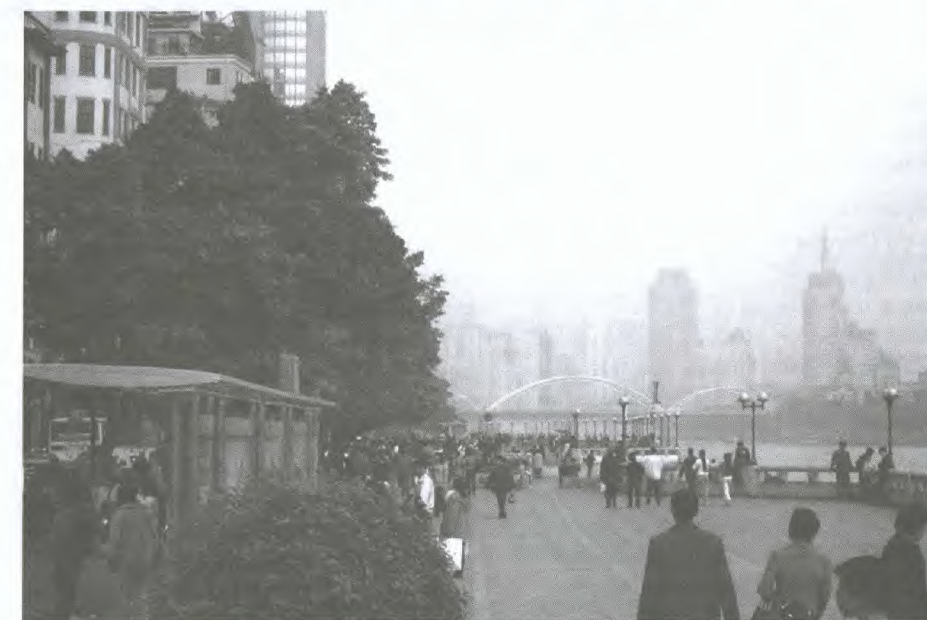
Guangzhou, sur les berges de la rivière des Perles

Le Guangdong, moteur économique de la Chine méridionale, fait face à des défis environnementaux importants en raison de l'urbanisation et de l'industrialisation croissantes. Le produit intérieur brut (PIB) de la province de Guangdong a atteint les 215 milliards de dollars (annuaire statistique de Guangdong, 1 er mars 2003) en 2002, une hausse de 10,8 % par rapport à l'année précédente. Le Guangdong a annoncé qu'il consacra 2,5 % de son PIB à la protection de l'environnement entre 2001 et 2005. Dans le delta de la rivière des Perles, il augmentera l'investissement à 3 % de son PIB.