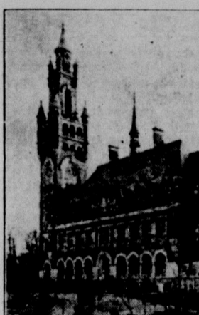
FredsPalatset i Haag.

Den tjugonde Internationella fredskongressen öppnades den 29 dennes i Riddarsalen i Haag under prinsgemälens Heimrichs af Nederländerna beskydd. Nägrarande voro 950 ombud, hvilka välkomnades af Nederländerns premiärministern Heemskerk.