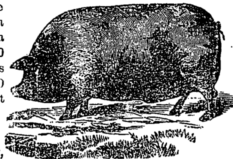
CHESTER WHITE HOG.

—Le Vapeur Notre-Dame laissera St. Hyacinthe le 19 avril, mardi à 9 heures du matin, pour St. Damasc et St. Césaire, partira de St. Césaire mercredi le 20 à 7 heures pour revenir à St. Hyacinthe et retournera à St. Césaire à 4½ heures de l'après-midi. Laissera St. Césaire le 21 jeudi pour St. Hyacinthe à 2 heures; de St. Hyacinthe pour St. Pie vendredi 22 pour St. Pie à 4½ heures et revenir de St. Pie le samedi aux heures ordinaires.