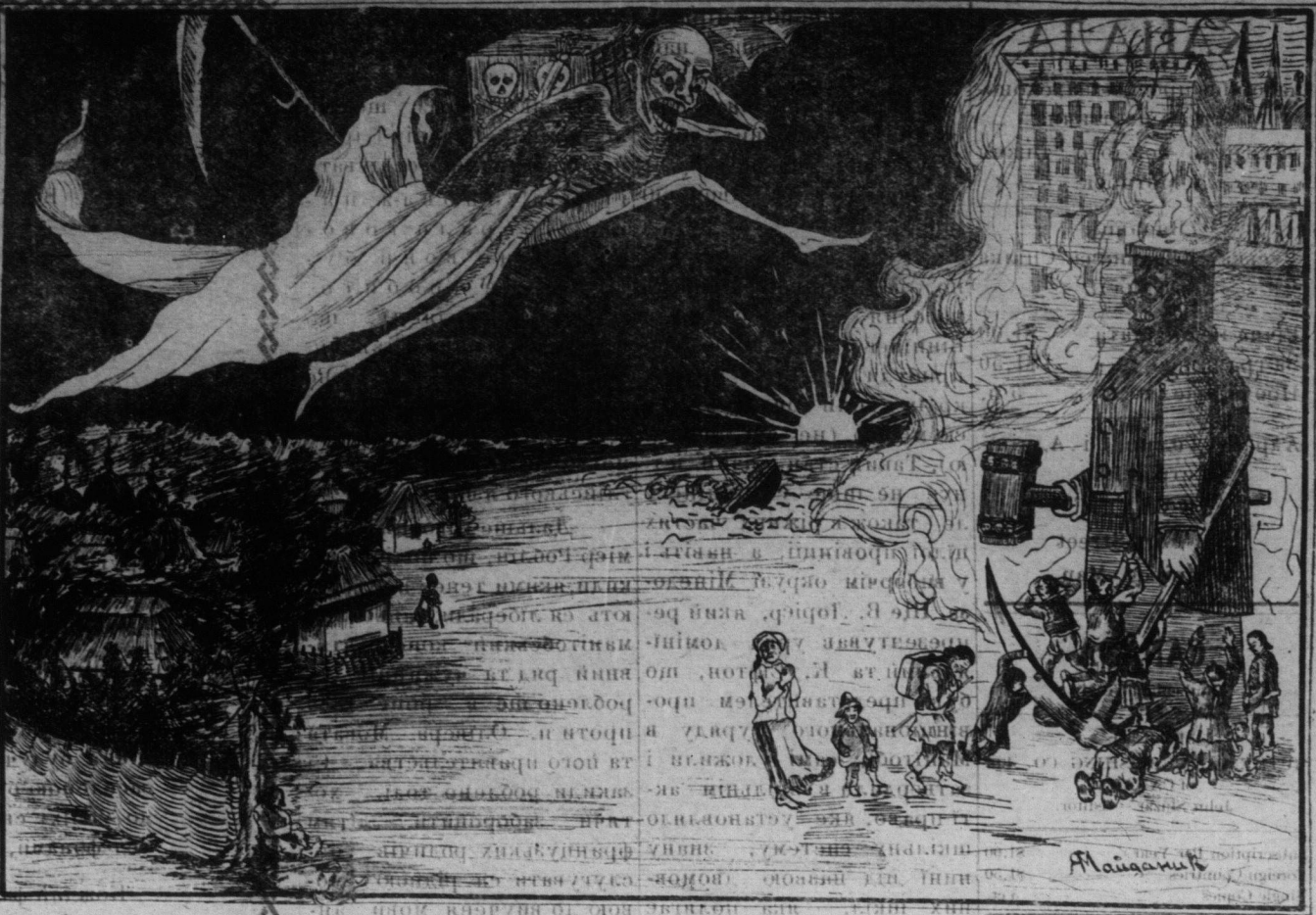
Поясненє до ілюстрації. Старинний край в обіймах „Голоду“, який симчасом несе готову „Смерть“. Люді з дрібними дїточками кидують рідну стріху і емігрують до Канади, як тверді і зміна, як вельо, а в якій горить будучина нашого наро- ду. Імігрантів не вїють в отвертих раменах, а мієто хліба даєть в руки шухлю і молот...

Чорногорскї звичай На народній Адрїатїк прийшло недавно до такої пригоди: Ой! Адрїатїк жалоє кільканадцять Чор- ногоричів! Тобу! Чим в пляні жди не було лїт- етанку в Дульчіно, Чорно-