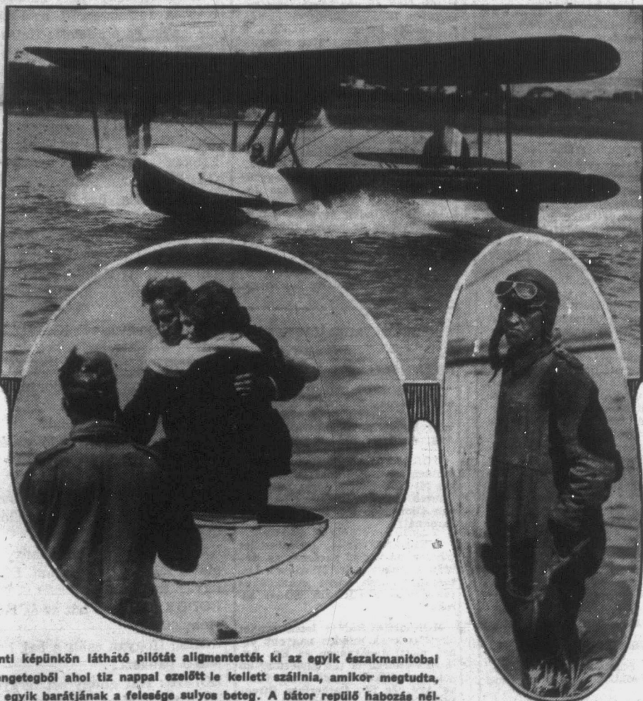
A fenti képünkön látható pilótát aligmentették ki az egyik északmanitobai örengotegből ahol tíz nappal ezelőtt le kellett szállnia, amikor megtudta, hogy egyik barátjának a felesége súlyos beteg. A bátor repülő hábozás nélkül azonnal gépére ült és három óra repülés után a legközelebbi kórházba szállította a nagybeteg asszonyt, akinek éppen az utolsó percben hajtották végre a műtétet.

A wellandi ferencrendi missió záróban (337 Hellems Ave) művészi kivitelű missió levélzáró bélyegeket kaphatók és pedig 100 darab 40 centért. Aki megrendeli e szép bélyegeket, csekély összeg fejében sok szép bélyeghez jut s emellett még a pogányok között működő ferencrendi missiók atyáit anyagilag támogatja áldozatos nehézségek toli munkájukban s azok nagy érdemeinek részese is leend.