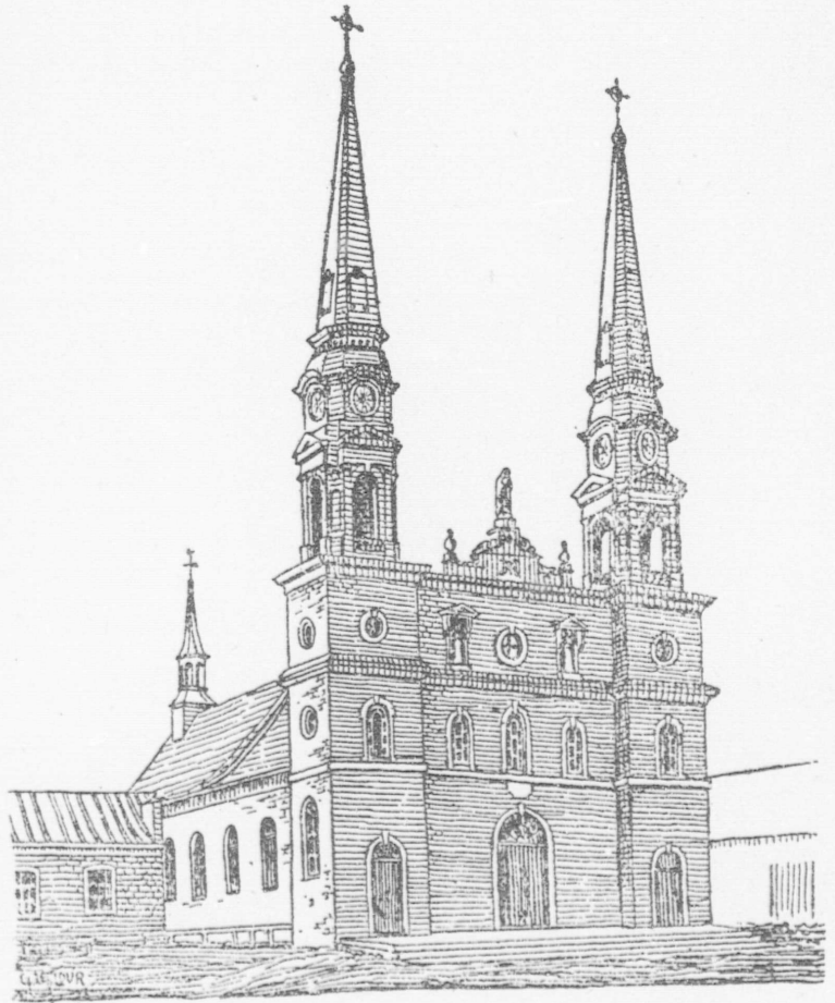
L'ANNONCIATION DE NOTRE-DAME DE BONSE- COURS DE L'ISLET