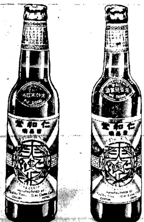
庄士安二十明認 味酒味藥嘗細 絕叫案拍汝包

蛤蚧 龍虎鳳 虎骨木瓜 烏脚 三蛇酒 熊掌末 六大名酒 是席上良朋，是體虛益友。 是經濟飲品，是滋補食品。