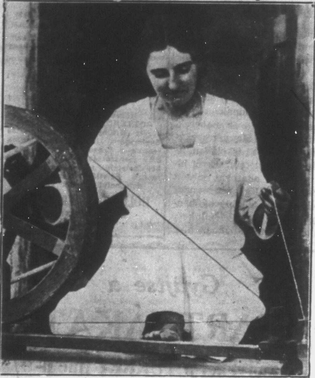
Mahatma Gandhi, titokzatos hindu szabadsághős törekvéseinek legfőbb támaszát, Madeleine Slade angol hölgyet mutatja képpünk, aki előkelő származása ellenére a hindu nép oldalára állott és India függetlensége mellett óriási propagandát fejt ki. Amint látható ő is hadat izent az angol szöveteknek és a házi-vászonkészítés elterjesztésével akar munkát biztosítani az éhezőknek.