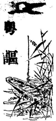
白鵝紅芳譜彩圖 差將玉貌門時趨

▲靈敏出與與溫度關係 瑞士科學家波古托氏。近發表靈敏出與與溫度關係。非至一定溫度時。決不出。故幼蛾破繭時。可用溫度表測之。如表上水銀在一米突下。蛾即立刻出繭。反此即遲三四日云。