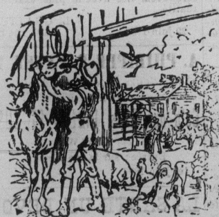
L'AMI DES PAUVRES.