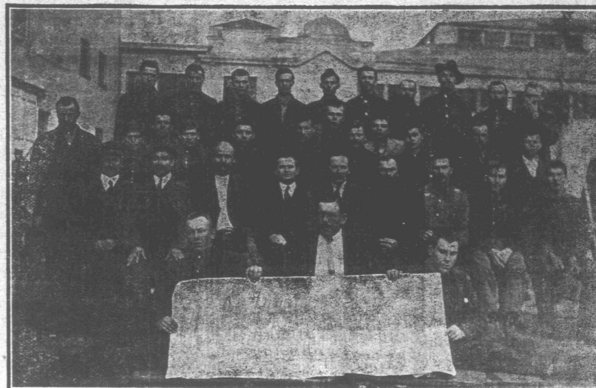
(Образ з календаря „Укр. Родина“ на 1916 р.)