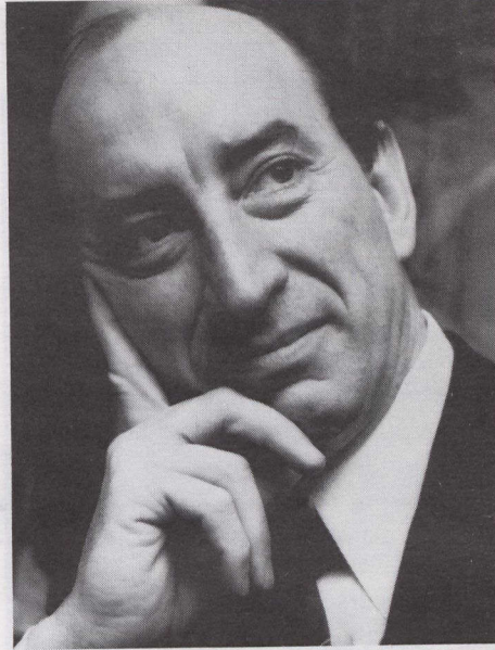
M. Marc Lalonde ministre des Finances

— 2 500 logements sociaux supplémentaires seront financés pour les ménages à