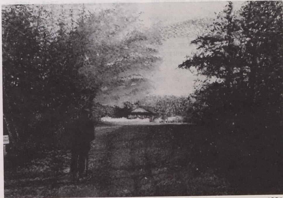
L'aube à la campagne, Estelle Brulé, pastelle à l'huile, style pointilliste, automne 1981. Estelle Brulé est une artiste de la région d'Ottawa dont les expositions connaissent beaucoup de succès.