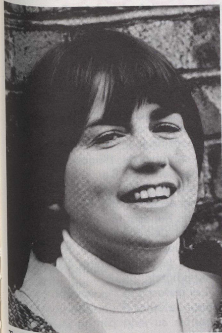
Terri Nash s'est mérité un Oscar pour le meilleur court métrage documentaire: Si cette planète vous tient à coeur.

Trois des quatre films canadiens en lice ont remporté la palme à la cinquante-cinquième cérémonie de remise des Oscars. If You Love This Planet (Si cette planète vous tient à coeur) , qui explique avec des extraits d'archives les dangers de l'armement atomique, a gagné dans la catégorie du meilleur court métrage documentaire.