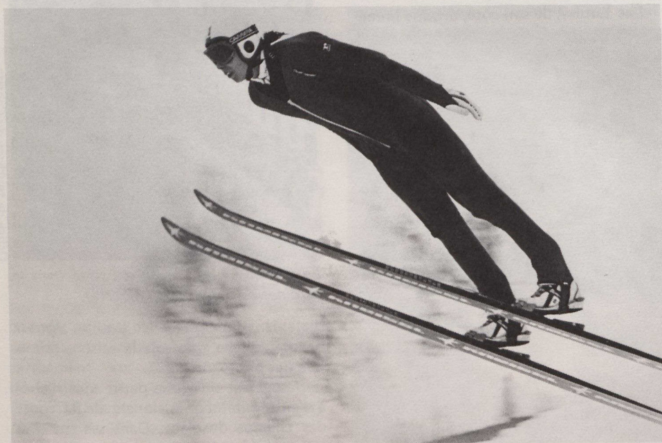
Le skieur canadien Horst Bulau s'est classé deuxième au Championnat du monde 1983 de sauts à skis. La victoire est allée au Finlandais Matti Nykaenen. La dernière épreuve du Championnat a eu lieu à Planica (Yougoslavie) le 25 mars. Horst Bulau a exécuté des sauts de 115 et 117 mètres contre 119,5 et 117 mètres pour le vainqueur.