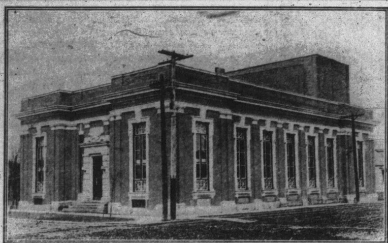
Український Робітничий Дім