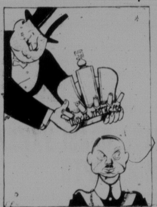
Французький капітал короноє циганського блазня на румунський трон. На короні вінок з гармат, спрямованих проти СРСР.

Недавно тому прибув до Бухарешта, столиці Румунії, корольський волкита Кароль і "селянський уряд" Манію проголосив його королем Румунії. Історія того "славного" короля досить таки цікава. Коли його матуля має за собою різні "коцфанешті", то Кароль ні має більше й голосищі.