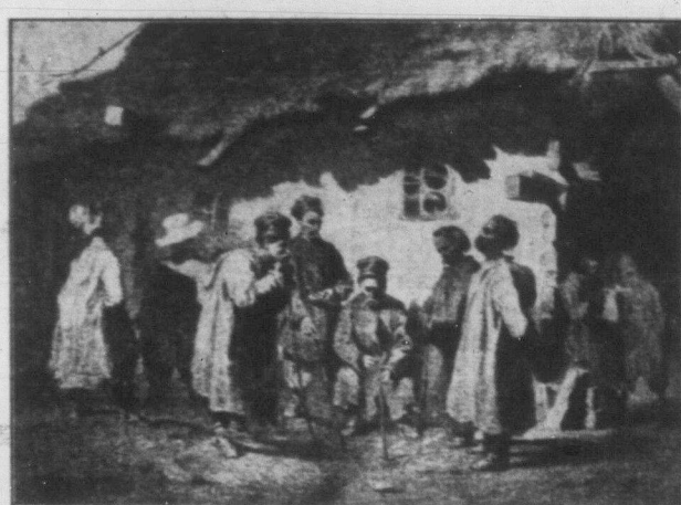
"СУДНА РАДА", малюнок Т. Г. Шевченка, з серії "Житописноі України".

Є в Шевченка один вірш, написаний у 1860 році, що дає найкращий підсумок цілого поета. Ось цей вірш: