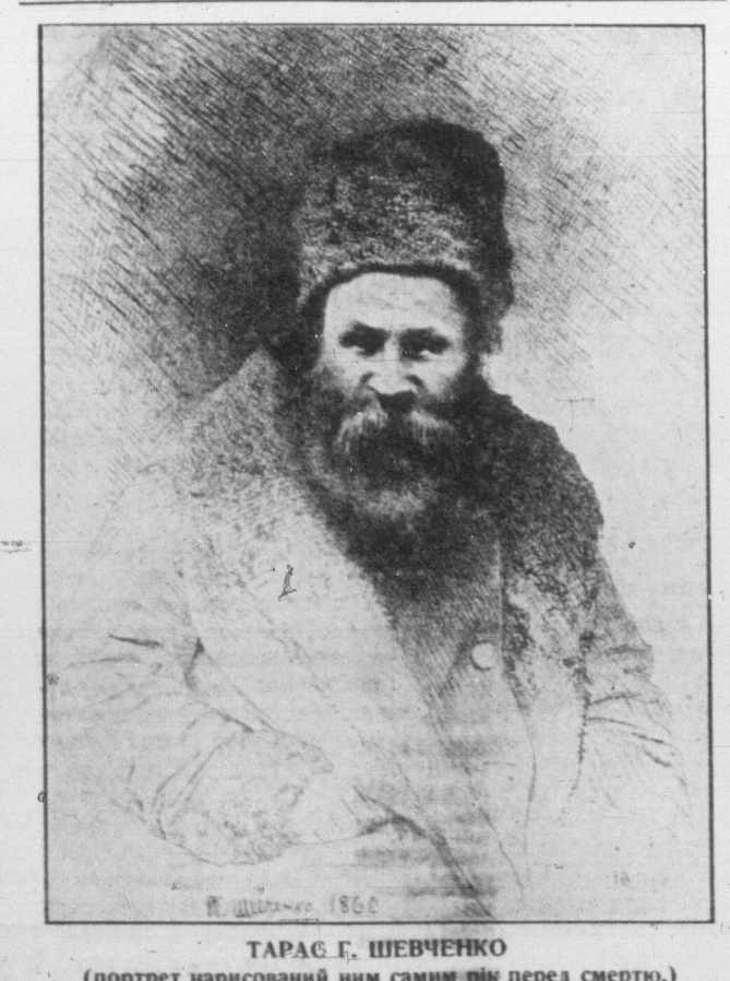
ТАРАС Г. ШЕВЧЕНКО (портрет написаний ним самим рік перед смертю.)