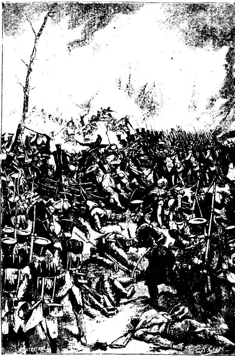
Le passage était forcé.—Page 186, col. 2.

Dès les premières détonations, M. de Vaudreuil avait donné l'ordre à tout ce qui était non combattant de repasser sur le territoire américain. Les femmes, les enfants, dont on avait jusqu'alors to-