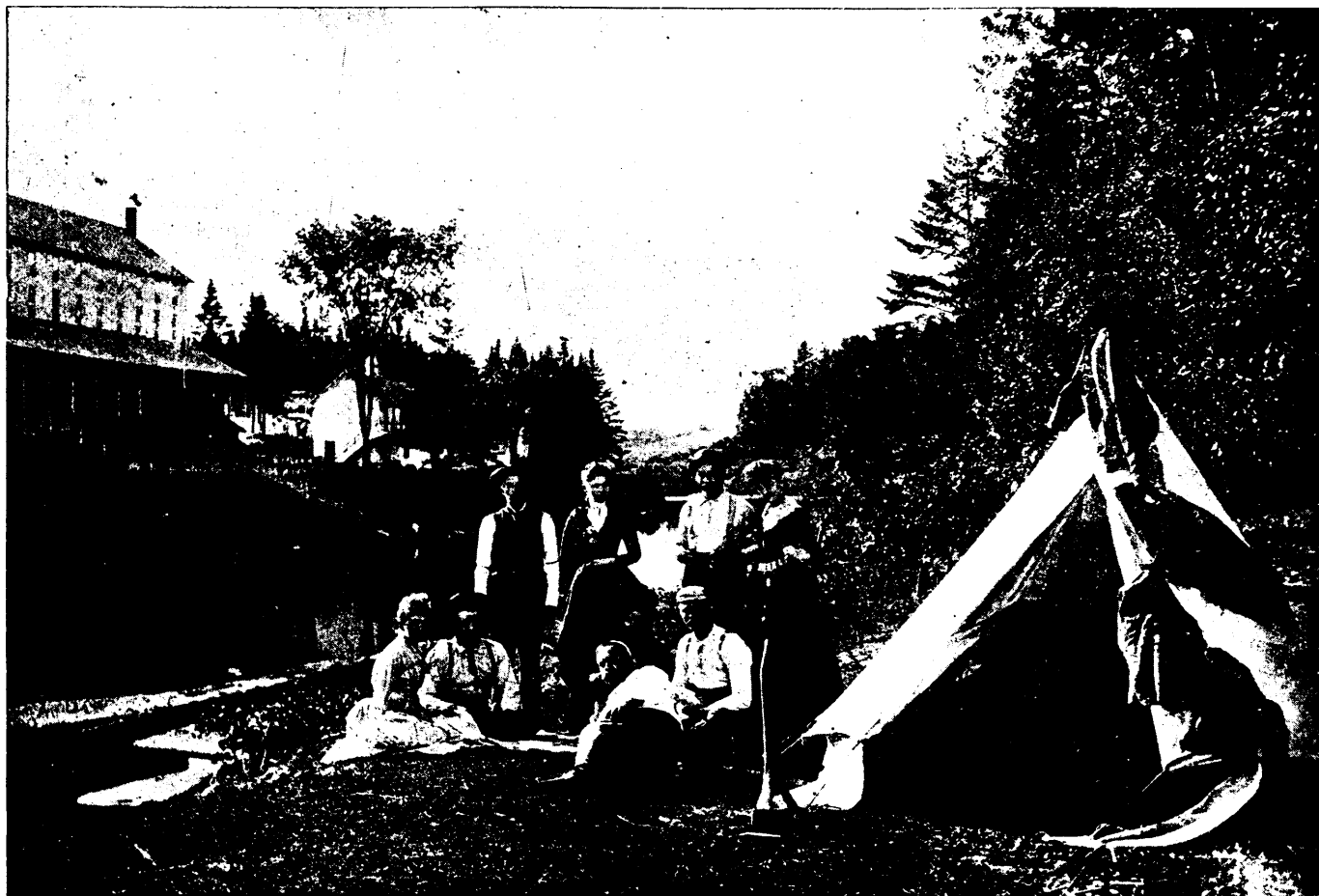
CANADA. — LES SOURCES SAINT-LEON