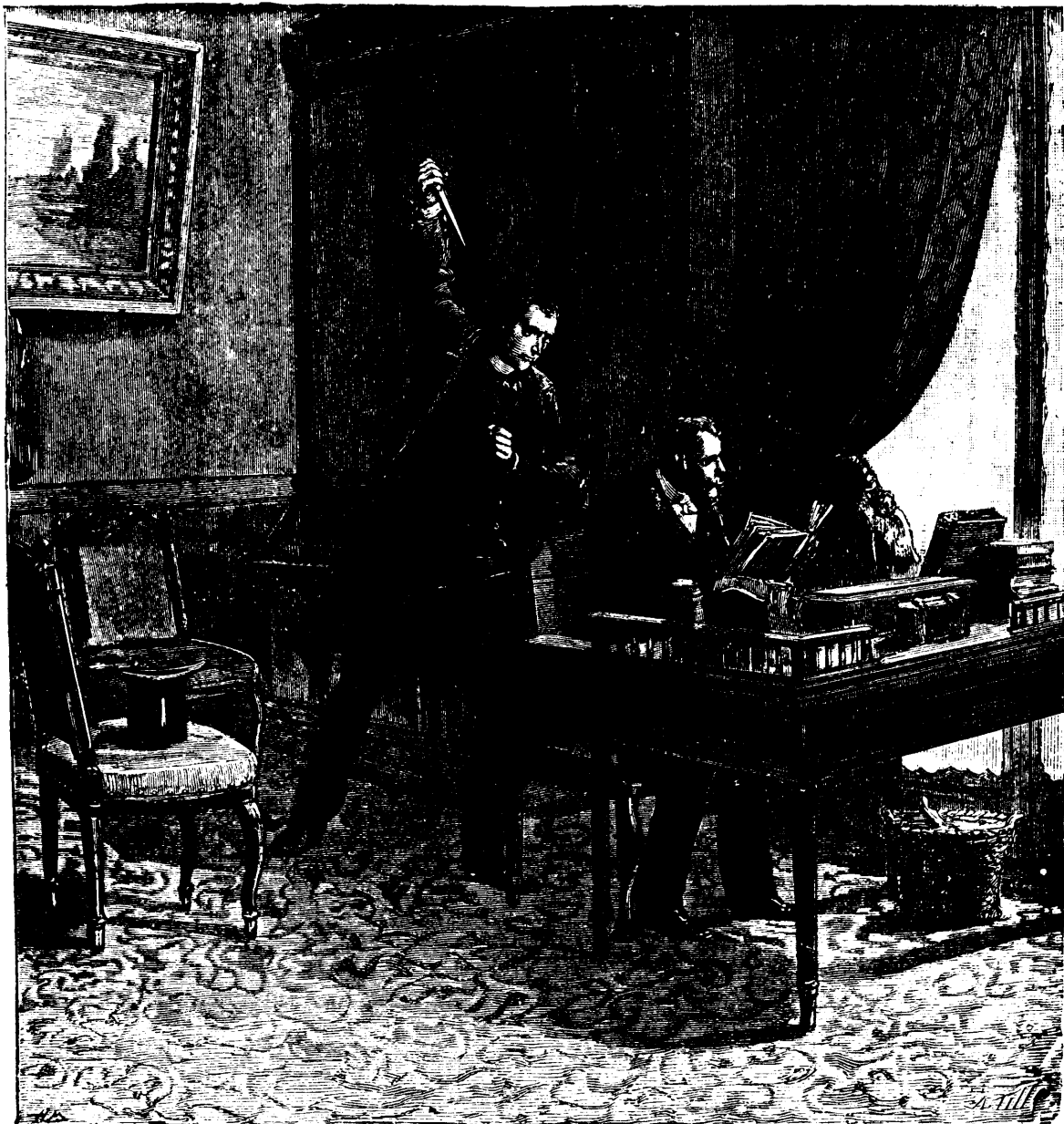
Il leva le bras et le stylet disparut tout entier entre les deux épaules.—Page 189, col 3

Il lui prend les mains et, soudain, de l'une des mains tombe la lettre de Patoche. Bernard la voit, la ramasse. Evidemment sa mère s'est évanouie en lisant ce chiffon de papier. Telle est sa première pensée. Et il le froisse entre ses doigts. Que peut-il contenir ? A-t-il le droit de le lire ? Oui, puisque ce papier est à ce point redoutable que sa mère s'en est évanouie. Il court à la signature :