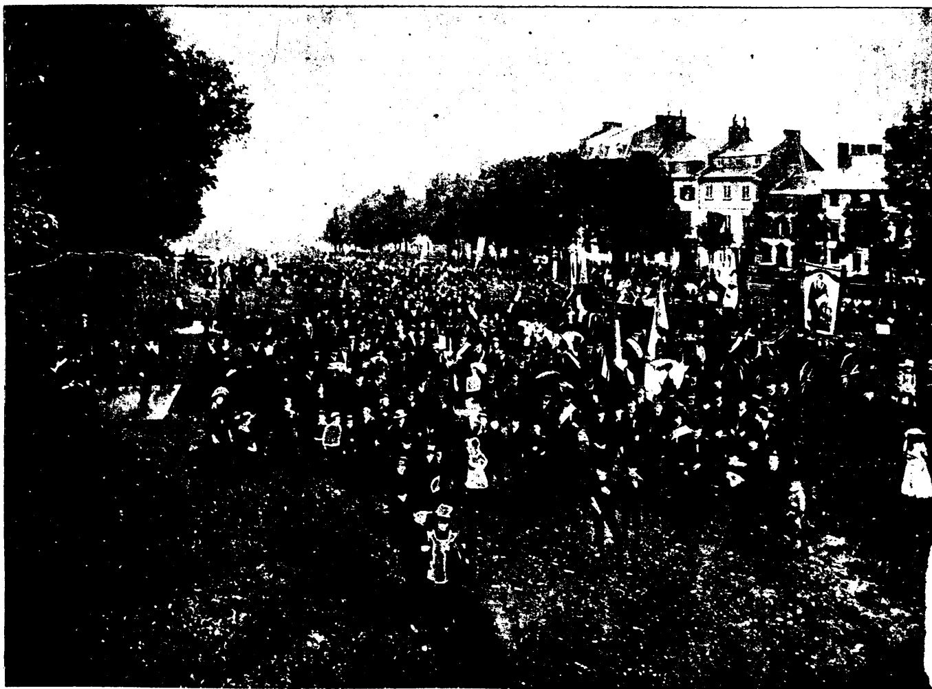
RÉUNION DES SOCIÉTÉS, SUR L'ESPLANADE, AVANT LE DÉPART DU CORTÈGE