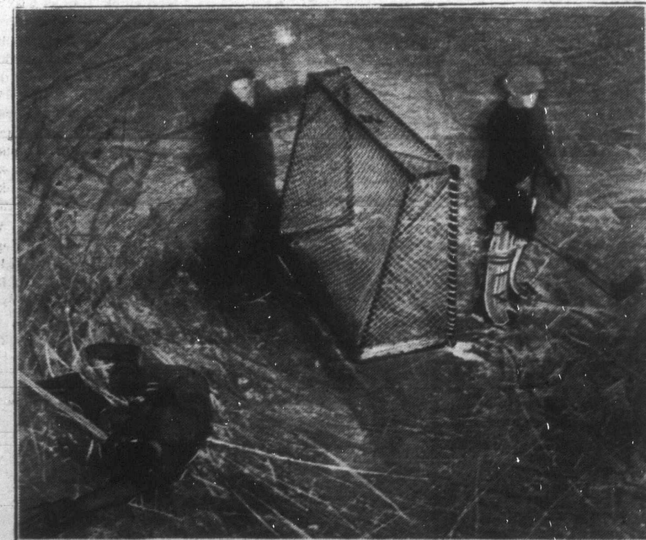
"The world's fastest game..." — "A világ legsebesebb mérkőzése": a jéghockey, magyarosan haki, mely száz és száz ezer sportbarátot tart nap-nap után izgalomban. A Lake Placid-en február 4-től 13-ig tartott olimpiai mérkőzések során is óriási érdeklődéssel kísérték az egyes nemzetek jéghakizóinak mérkőzését. Képiunk éppén egy izgalmas jelenet látható a kapu előtt.

Kanadában a rágógumitól eltekintve Wrigley arról volt nevezetes hogy az évenként Torontóban tartott nemzeti kiállítások alkalmával rendezett uszó és sportversenyeket sok ezer dollárral pártolta. Ennél sokkal nagyobb feltűnést keltett — különösen Nyugatkanadában — az a nagyszerűen bevált hirdetői terve, hogy több-millió bushel búzát vásárolt, amikor a buzaárak éppén a legalacsonyabbak voltak. Wrigley ezáltal nem spekulálni akart az alacsonyan vásárolt búzával, hanem a kereslet élénkítésével a buza árfolyamat akarta emelni és ezáltal viszonzni óhajította azt a sok pénzt, amit a kanadaiak centenként adtak neki az évek folyamán.