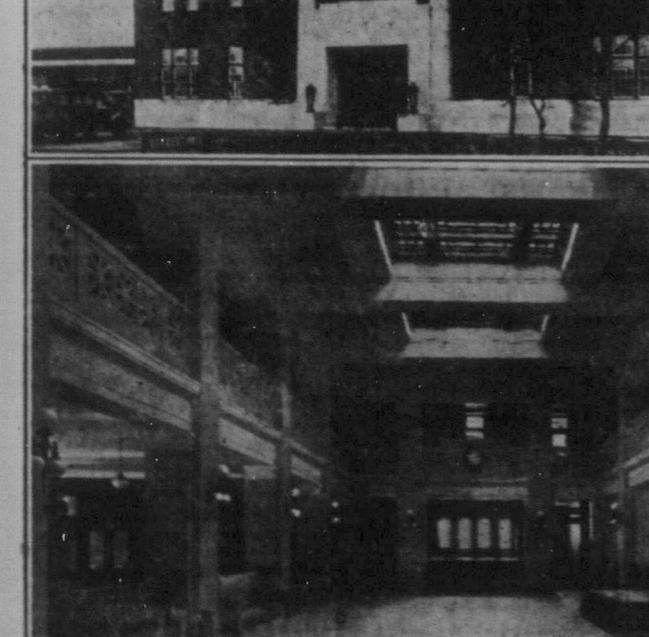
Canadian Nationals nya station i Edmonton.