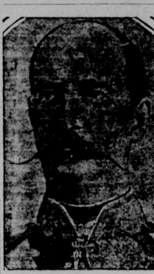
Konung Georg I.

I förlidet nummer omtalades i kort, att konung Georg af Grekland i tisdags f. v. blifvit mördad. Själva händelsen hade i korbet tillgätt sålunda: Den gamle konungen kom helt sorgligt gående på en gata i Saloniki, i sällskap med en adjutant, då två män stego ut ur ett hus och gingo i samma riktning som konungen. Denne blef uppmärksam på de två människors betedande och vände sig om blott för att stå ansikte mot ansikte med lönnmördaren, som ryckte upp en revolver och sköt konung midt i hjärtat. Såväl våldsmän-