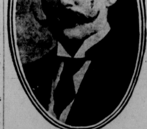
Konung Konstantin I.