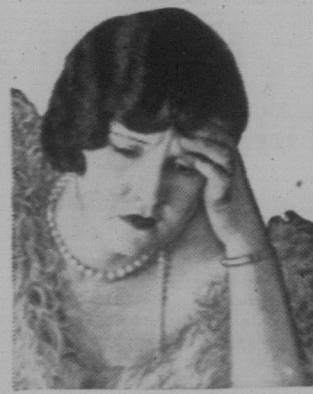
Leiden Sie nicht an Kopfschmerzen, denn die Tablette Aspirin kann dies in einer Minute beseitigen.