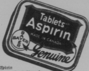
Tablets Aspirin GENUINE