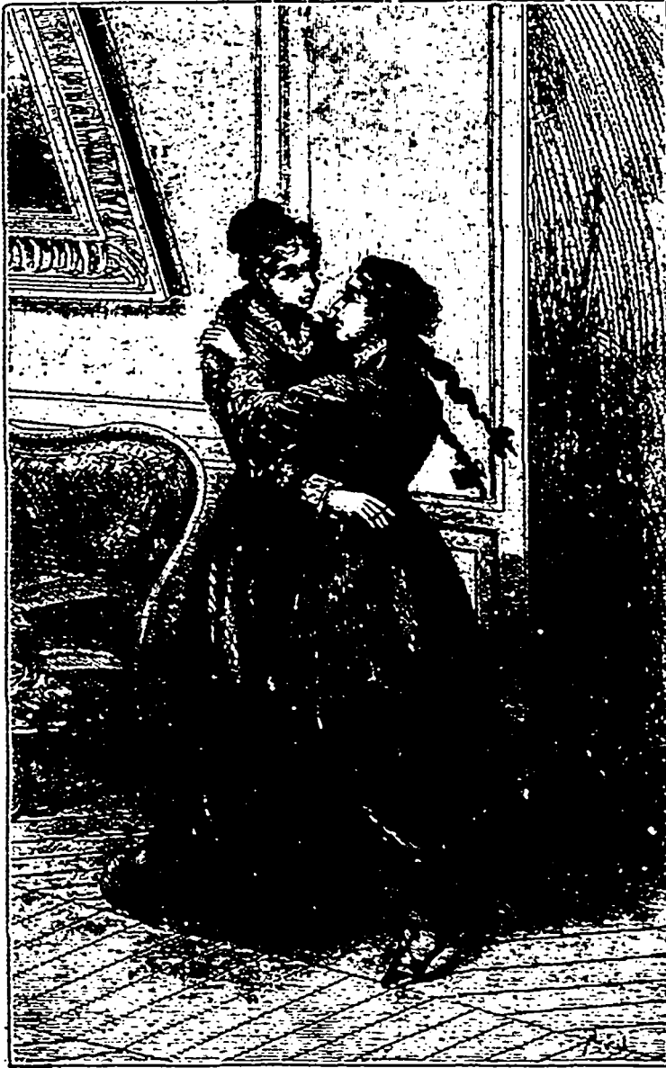
Ce fut alors un murmure de baisers donnés et rendus.