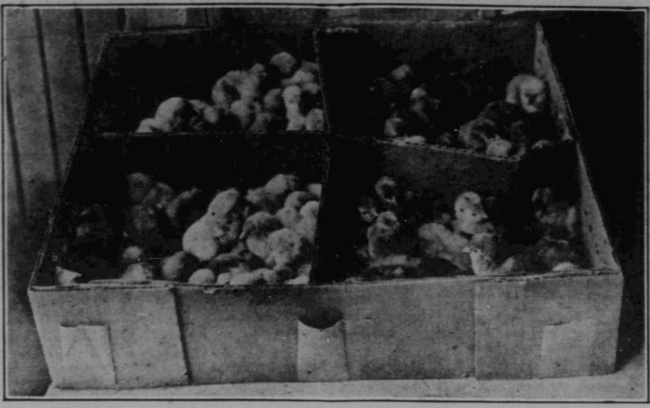
Man hör nu för tiden ofta tala om "babies", som uttrycket är för de många barn som föds i Kanada. Här är en låda med förtio sådana "babies".