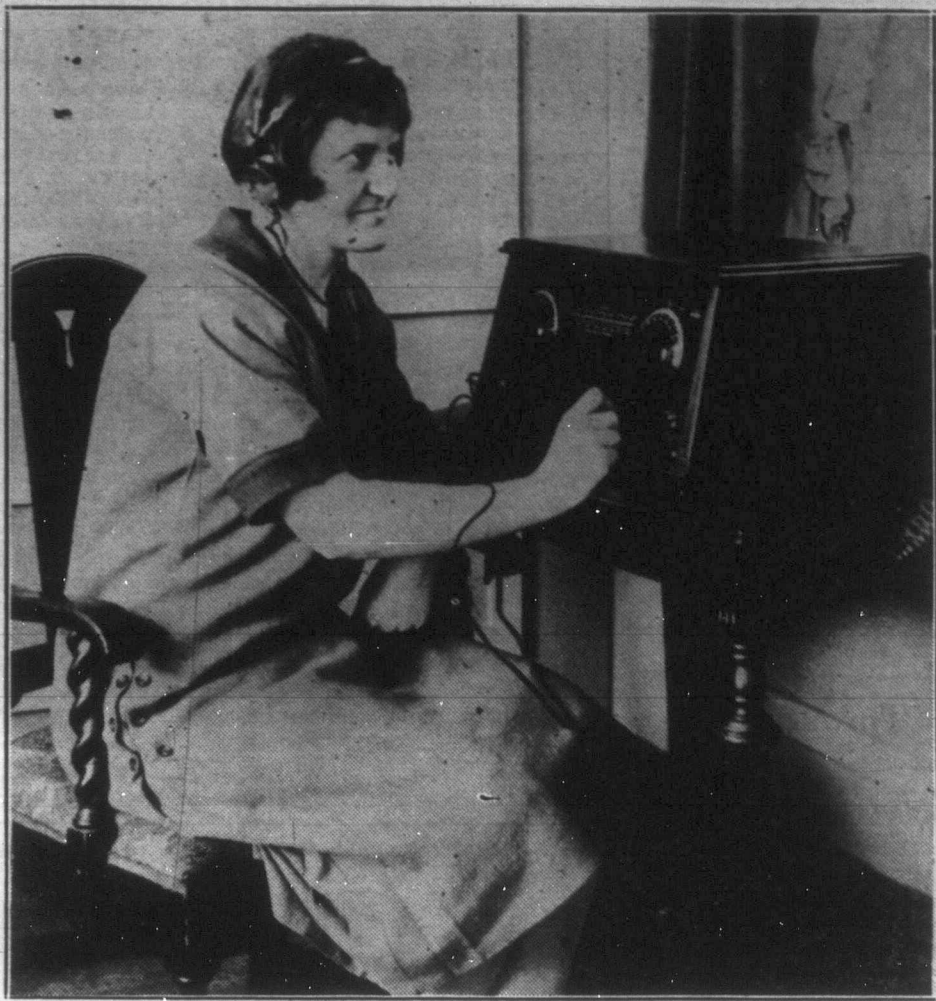
A technika legújabb vívmánya: a süketeknek készített fejhallgató. A bonyolult szerkezetű fejhallgatóval a süketek is teljesen tisztán hallhatják a rádió programokat.

A tudósok többször rámutattak arra, hogy a földrengés sulyos és szomorú tapasztalatát fel kell használni, nehogy a fontosabb műveket a földrengés után ismét a földrengés "vonalára" építsék. A san-franciscóiak azt tartják, hogy az igazi kárt nem annyira a földrengés, mint inkább a tűz okozta. Ez