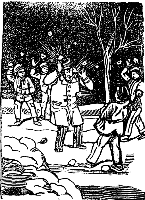
Complètement désintéressé des luttes des partis, se trouver inopinément pris entre leurs feux croisés.

vers les prisonnières des mains tremblaient leurs postes avec beaucoup de peine et l'obscurité vint sur tout à coup cette désolation fut accrue par un éclat de rire de ces malheureux !