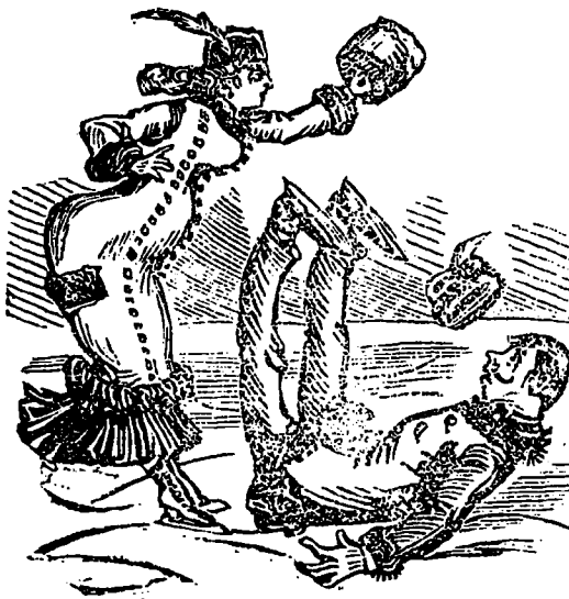
—Voilà, Monsieur, la troisième fois que vous tombez à mes genoux, serait-ce une déclaration ?