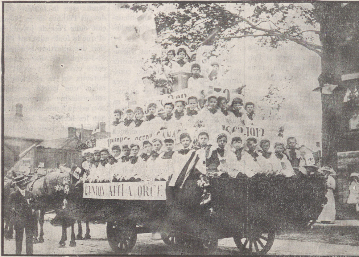
Char allégorique, symbolisant les 50 années d'existence de la Société.

Nos amis de Hull ne le cèdent en dévouement à personne. Dès les premières heures du jour, dimanche, le 1er juin, ils étaient sur pied, s'organisant pour la procession des noces d'or de la St-Joseph. Au son des clairons et tambours, de toutes les rues venaient des bataillons de membres des sociétés nationales et surtout de la St-Joseph, bataillons qui convergeaient au bureau du Conseil local Notre-Dame, rue Principale. De là, à huit heures, on se mit en marche, fanfare en tête, pour se rendre à Ottawa en passant par les rues Champlain, Victoria, Notre-Dame, Division, Laurier, Youville et le Pont Interprovin-