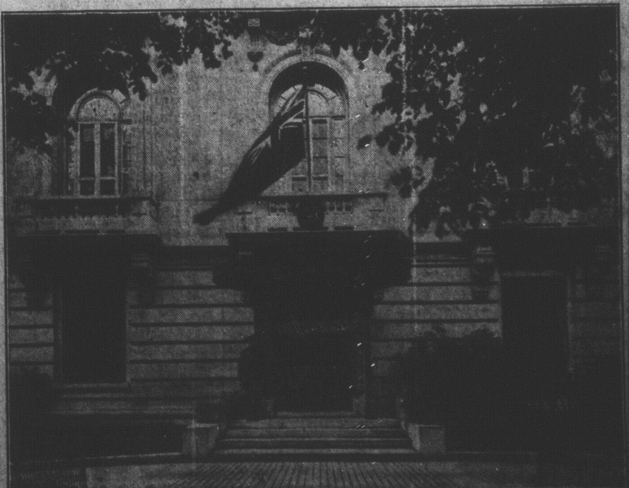
LE CANADA A WASHINGTON

Il y a au Canada, 111 journaux quotidiens, 9 publications tri-hebdomadaires, 30 bi-hebdomadaires, 967 hebdomadaires, 33 périodiques bi-mensuels, 331 revues mensuelles et 27 trimestrielles, au total 540 en tout. Il est difficile d'obtenir des statistiques pour tous ces genres de publications antérieurement à 1892, mais cette année-là, il y avait 96 quotidiens, tri-hebdomadaires, 22 bi-hebdomadaires, 653 hebdomadaires, 30 bi-mensuels, et 217 mensuels. "La Clé d'Or"