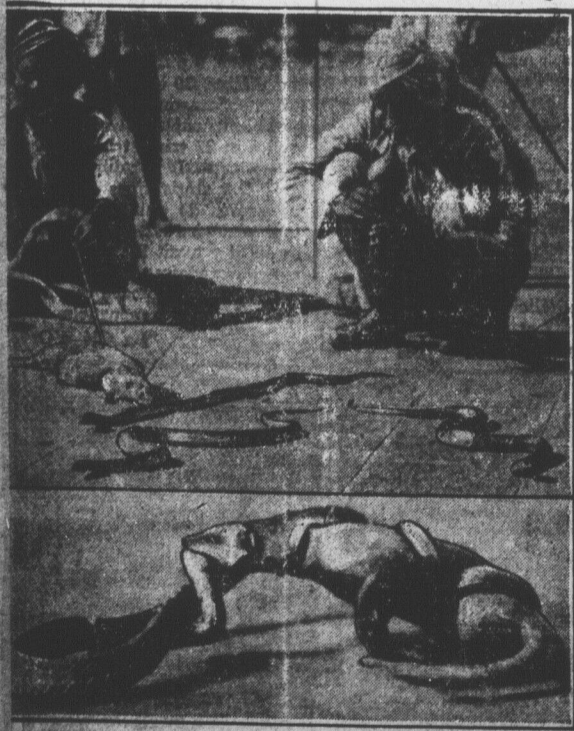
Sur la photo supérieure, nous voyons un Hindou en train d'exécuter, avec un cobra, un exercice qui consiste à lancer une mangoustine, sur son dos. La mangoustine dévore la tête d'un cobra, qui l'enserra de ses puissants anneaux. Les photos, qui nous sont communiquées par "un des passagers actuels" en croisière autour du monde, à bord de l'"Empress of Scotland" du Canadien, représentent deux épisodes d'un combat à mort entre mangoustine et un cobra, combat auquel il fut donné d'assister à un groupe de voyageurs de l'"Empress of Scotland", lors de leur récent passage à Bombay. Le mangoustine, petit animal carnassier très commun dans l'Inde et grand destructeur de serpents, fut lancé sur un cobra de 5 pieds de longueur, qui avait préalablement excité et irrité au son d'une flûte. Le combat s'engagea immédiatement, et au début, les spectateurs s'attendaient à voir le cobra déjà la mangoustine étouffée dans les puissants anneaux de sa gorge. Mais la nature a doué le vaillant petit carnassier d'une osature solide. La seconde photo, dépeignant la tête du cobra, qui cependant, n'a pas été complètement lâché prise. Le combat intéressa beaucoup tous ceux qui en furent témoins, et la scène qui se passa fut photographiée de telle sorte qu'il fut une vive impression sur les assistants, pour habitude à ces sortes de spectacles. Le mangoustine s'approcha d'abord et dans un premier moment, aux yeux de la garde pour se protéger contre les serpents, particulièrement les cobras, qui infestent ce pays.

Chartreuse, spoliée et désaffectée par l'Etat, en 1903, voici qu'une municipalité, celle de S.-Pierre d'Entremont, Isère, adopte une résolution énergique dans le même sens.