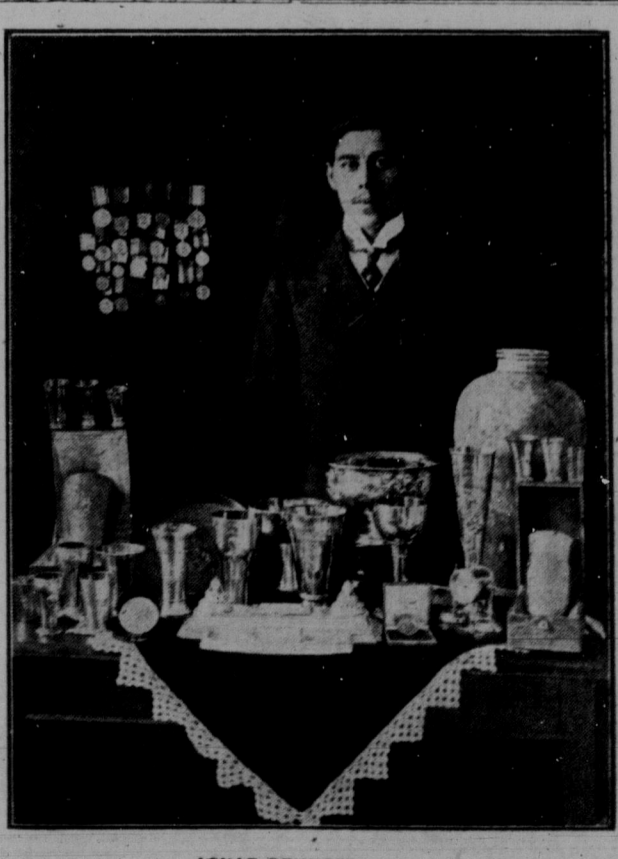
AGNAR REHNBERG, den kände svenske backåkaren med en del af de af honom eröfrade prisen.