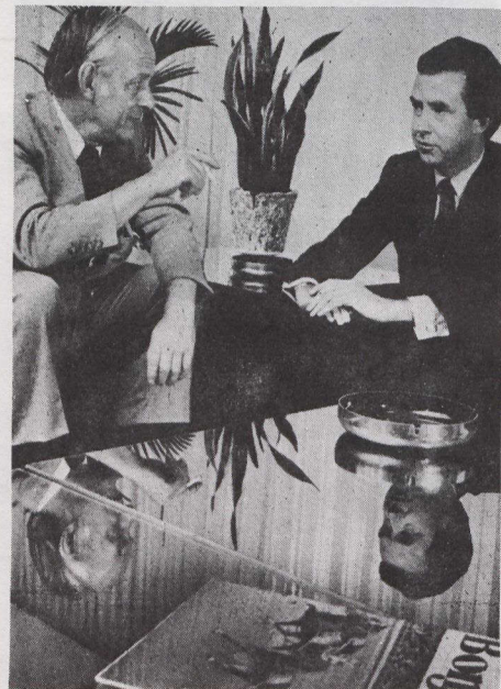
René Lévesque conversa con el Primer Ministro Clark (derecha) después de la conferencia de primeros ministros provinciales celebrada el mes pasado.

El señor Clark indicó también que se prosiguen planes para una conferencia nacional económica "que proporcionará a los representantes del sector privado y de los gobiernos federal y provinciales un foro para comenzar el trabajo sobre el ro bustecimiento de la economía".