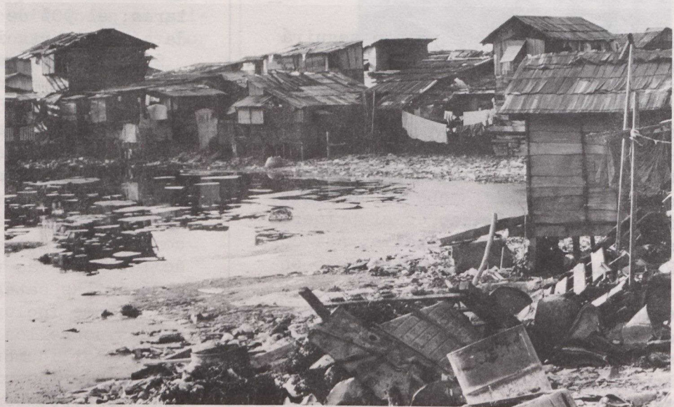
En las ciudades asiáticas, los barrios de latas crecen rápidamente, creando inmensas necesidades de alojamiento, empleo, agua potable y otros servicios.

En relativamente poco tiempo, el Instituto alcanzó su objetivo primario, aliviar la escasez crítica de ingenieros altamente calificados en los países en desarrollo del sudeste asiático. Ahora, el apoyo de Canadá al Instituto adoptará una nueva dirección. Uno de los problemas mundiales más acuciantes es el rápido crecimiento de las ciudades: para finales del siglo, la población urbana habrá sobrepasado a la población rural por primera vez en la historia.