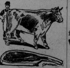
Fresh Meat always on hand.