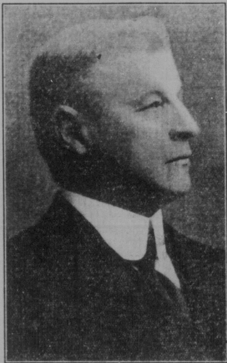
HUGH GUTHRIE. Canadas justitieminister.

Två intressanta ministerporträtt ur vårt politiska bildgalleri.