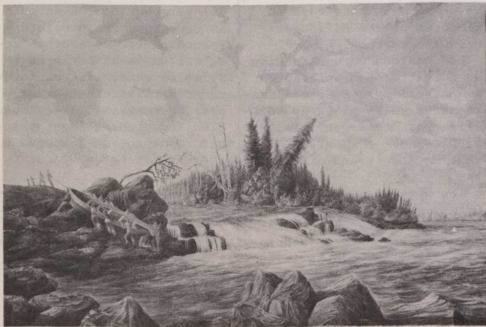
Cataratas y portazgo del río Trout, Territorios del Noroeste, 1819.

En 1970, el Gobierno de Canadá compró la colección Coverdale y la ofreció a los Archivos Públicos. La Galería Nacional recibió 62 acuarelas, estipulándose el acceso de los canadienses a dichos trabajos por medio de exposiciones.