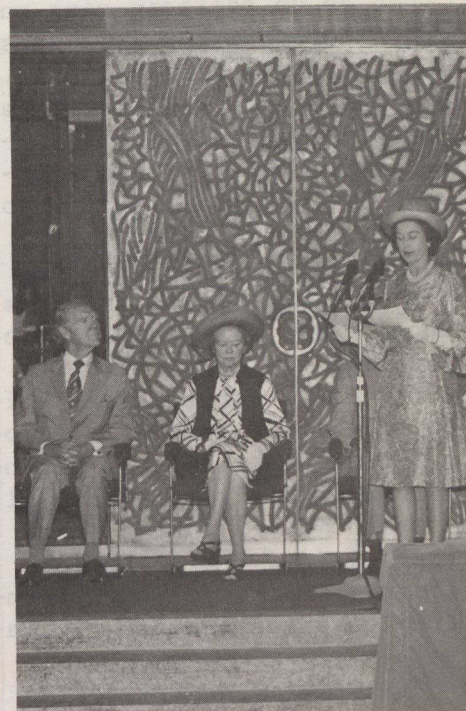
La Reina Isabel en compañía de la viuda de Pearson y el Ministro Mitchell Sharp.