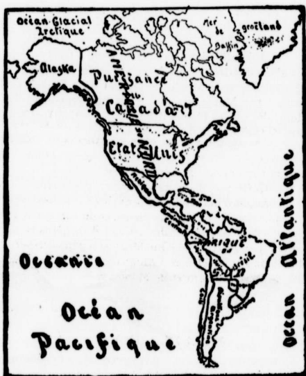
CARTE DE L'AMÉRIQUE