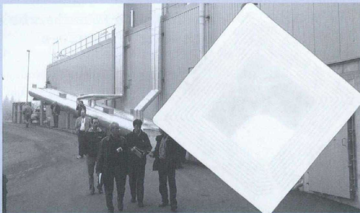
La délégation canadienne visite les usines de biogaz de l'Autriche et du Sud de l'Allemagne.

En fait, cette fermentation est l'un des procédés de conversion de la biomasse en biogaz les plus efficaces. Le méthane