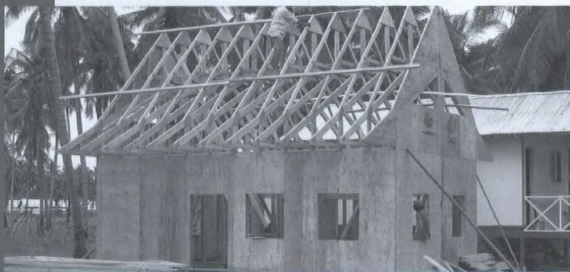
Les entreprises canadiennes ont fait don de 10 maisons à ossature en bois à l'écovillage de Labui à Banda Aceh, Indonésie.

rizières et à localiser les endroits qui se prêtent à la construction de refuges. Intermap a récemment obtenu de l'Agence canadienne de développement international (ACDI) des fonds destinés à accroître les transferts de technologie à l'Indonésie par la formation des techniciens indonésiens en système d'information géographique à l'utilisation de données radar dans l'établissement de cartes topographiques au trait.