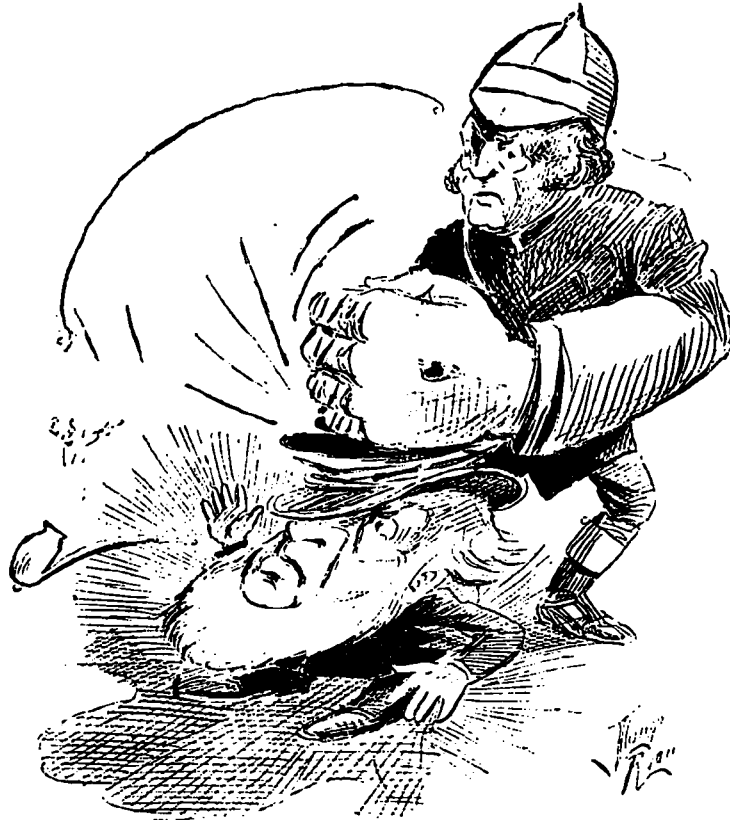
John Bull a le bras long et la main lourde avec les faibles.

Quand vous recevez le moindre emballage de la gorge prenez vite une petite cuillère de BAUME RHUMAL . Vous vous en trouverez bien.