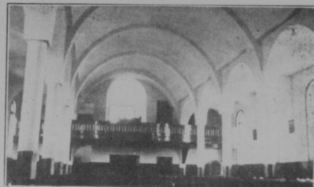
Innere der Kirche.