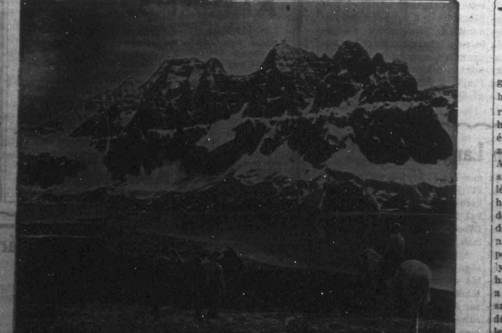
Az idén sokkal kevesebb amerikai turista jött Kanadába, mint az előző években. Ez a körülmény igen megcsappantotta azoknak a keresetét, akik mindaddig biztos megélhetést vártak a Kanadába látogató amerikaiaktól.