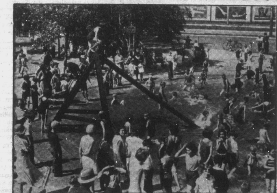
A nagyvárosok egyes iskoláinak udvarán legújabb népfürdőket állítottak fel a munkágyermekek üdülésére.