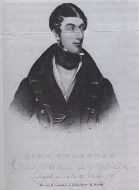
Portrait posthume de Charles Poulett Thompson, baron Sydenham.

À Canberra, les dramaturges canadiens ont participé à l' Australian National Playwrights' Conference , à laquelle Carol Bolt représentait le Canada. À cette occasion, des comédiens australiens ont présenté des morceaux choisis de l'oeuvre de Carol Bolt. Dans les réunions et les colloques prévus l'auteur a donné un aperçu du théâtre canadien contemporain et discuté des problèmes inhérents à la dramaturgie canadienne.