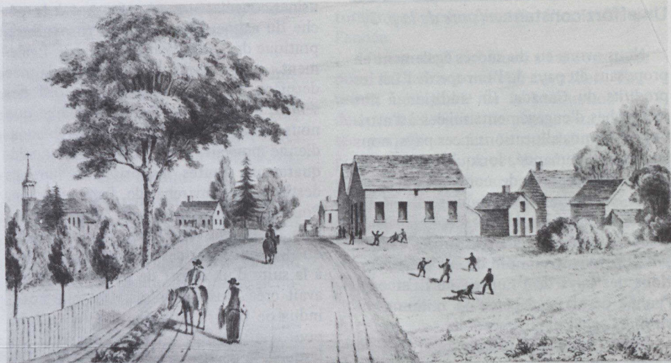
École de district, Cornwall, vue du sud. Lithographie rare publiée en 1845 par John J. Howard, architecte et peintre; l'une des lithographies exposées dont le nombre total s'élève à plus de cent.

Les scènes de rue et les études d'édifices, parfois tirées pour commémorer l'achèvement d'un ouvrage qui faisait la fierté de la ville, étaient parmi les lithographies les plus appréciées. L'Exposition