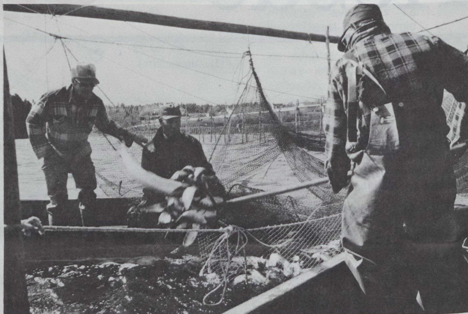
Des charognards sont regroupés en vue de leur transport dans une pisciculture. On appelle charognard le saumon de l'Atlantique lorsqu'il retourne à la mer après le frai.

— améliorer des bateaux de pêche de façon à favoriser le maintien de la qualité;