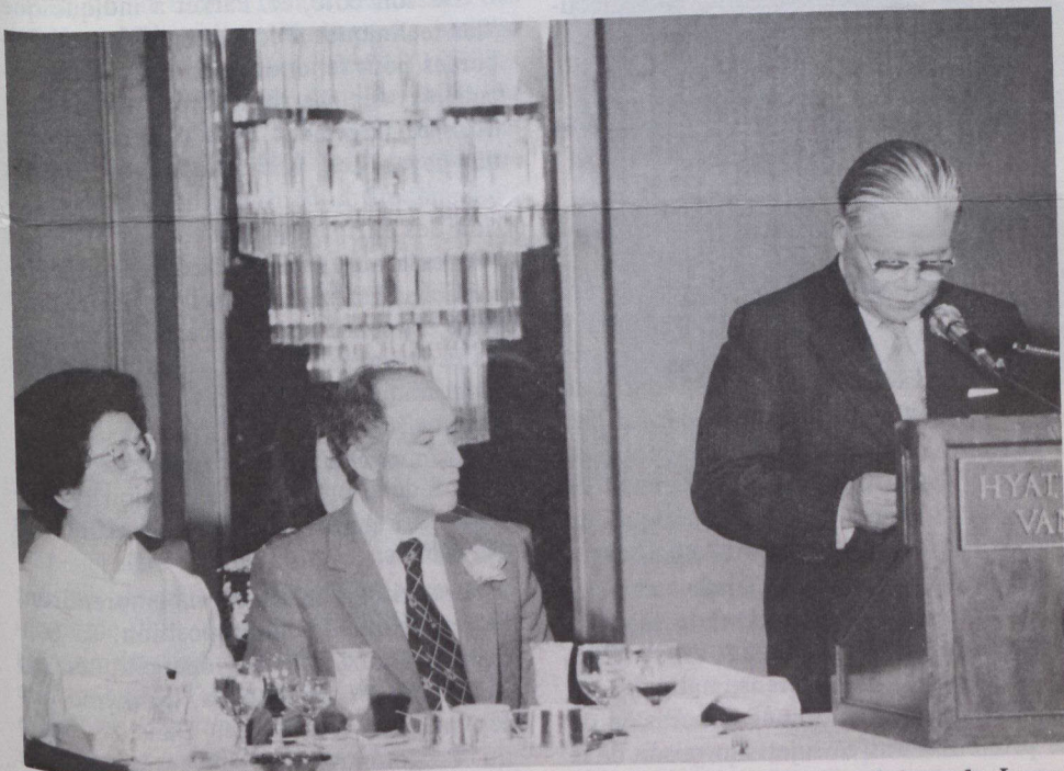
Lors du dîner de gala offert en son honneur à Vancouver, le premier ministre du Japon, M. Masayoshi Ohira, prononce une allocution qu'écoute attentivement le premier ministre Trudeau. A la droite de ce dernier on reconnaît Mme Ohira.

M. Trudeau a par ailleurs souligné la contribution des Canadiens d'origine japonaise au développement du Canada: "Je suis également heureux que vous et Mme Ohira ayez manifesté le désir de visiter la Colombie-Britannique parce que cette province est habitée par un grand nombre de Canadiens d'ascendance japonaise. Nous sommes fiers de leur contribution exceptionnelle à tous les aspects de la vie canadienne et je voulais partager ce sentiment de fierté".