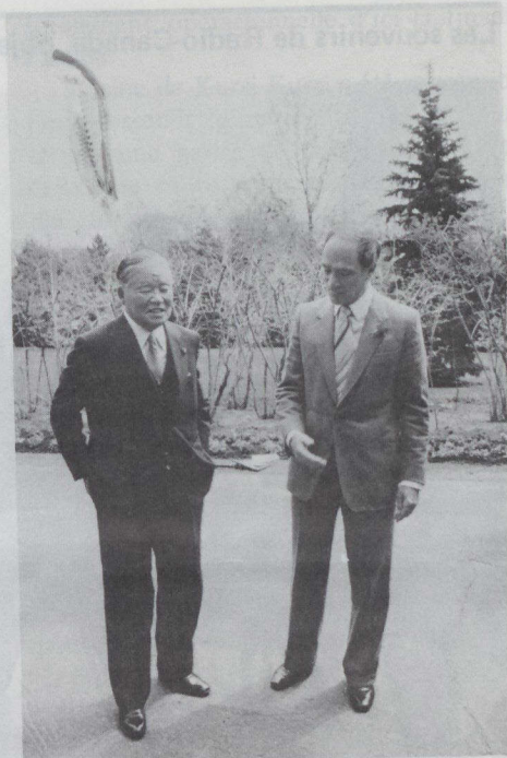
MM. Trudeau et Ohira prennent quelques instants de détente dans le jardin de la résidence du premier ministre du Canada, à l'issue de leurs entretiens.

A l'issue de ses entretiens avec le premier ministre du Canada, M. Ohira a rencontré le chef de l'Opposition aux Communes, M. Joe Clark, ainsi que les membres du Comité de coopération commerciale Japon-Canada.