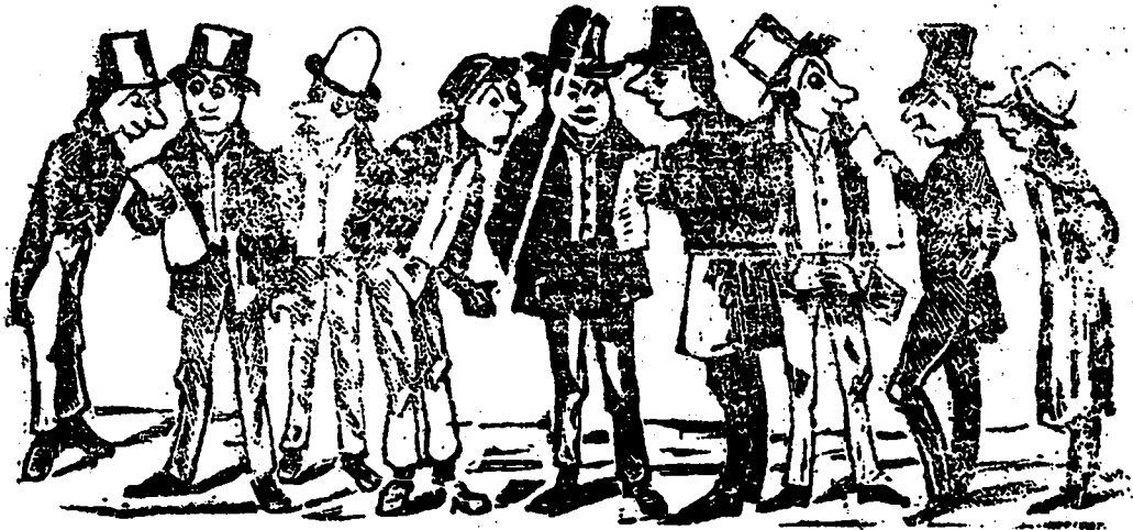
Aspirants aux charges Publiques.

toute les nations ; l'Amérique s'ennorgueillira d'avoir produit le génie qui aura changé la face du monde ; l'Europe, l'Afrique et l'Asie s'émerveilleront en voyant l'oeuvre sublime d'un génie inspiré.