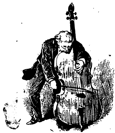
Les femmes portant culotte

Voici quelques renseignements donnés par la préfecture de police sur les femmes autorisées à porter l'absurde costume masculin :