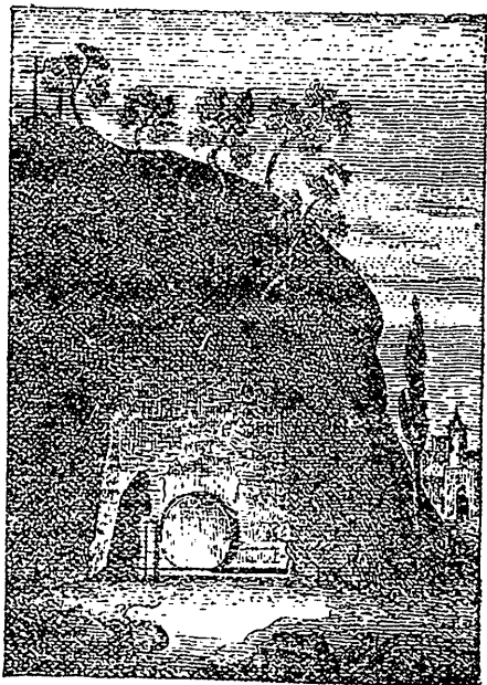
LE TOMBEAU DE NOTRE-SEIGNEUR